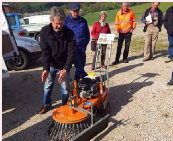
Präsentation der Wildkrautbürste