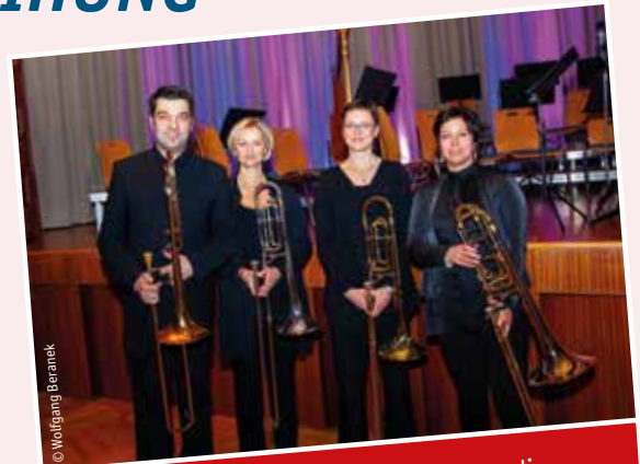
Das Posaunenquartett ViWaldi umrahmte die „Applaus-Award-Verleihung“