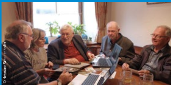
Topothekare beim Stammtisch

Besuchen Sie den YBBSER TOPOTHEK-STAMMTISCH: jeden 1. Donnerstag im Monat ab 18 Uhr Ort: Gasthof Mang-Höllner, Herrengasse 8