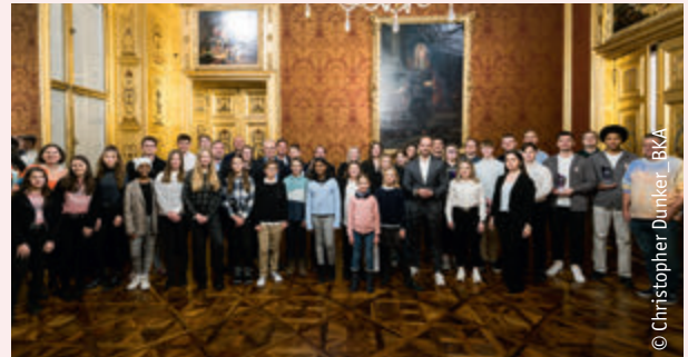
Alle Teilnehmer:innen des SZ Ybbs beim Abschlussfoto mit Staatssekretär Tursky im Finanzministerium in Wien.

IT-HTL Tel: 07412 52575 Mail: htl@sz-ybbs.ac.at