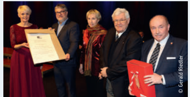
BGMin Ulrike Schachner übernahm für die Stadt Ybbs die UNESCO-Urkunde zur Ernennung zum Weltkulturerbe.