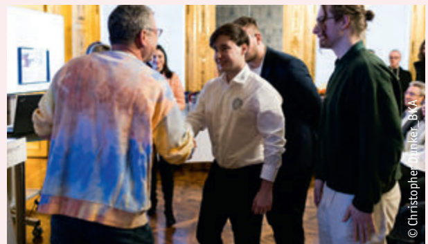
Schüler:innen des SZ Ybbs zeigten u. a. in der Kategorie „Spiele Programmierung – Professionals“ auf.