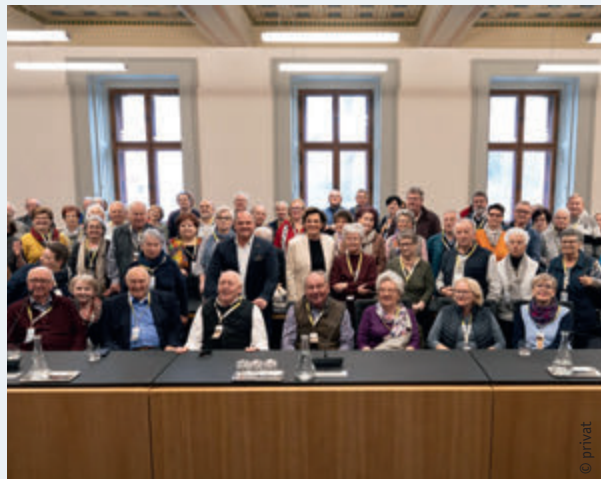
Klubobfrau Rendi-Wagner & Abg. z. NR Schroll begrüßten im März Besucher:innen aus Ybbs im neuen Parlament.

+++ Stadtbücherei Ybbs +++ Stadtbücherei Ybbs +++