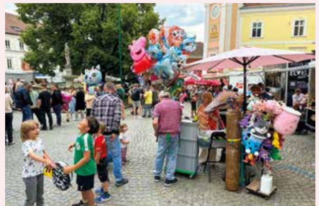
Auch für Kinder gab es zahlreiche Attraktionen in Ybbs.

Das gastronomische Angebot reichte von Zuckerwatte, Palatschinken und leckeren Waffeln bis zu Pizza, Bosna und Ybbsburger. Rotes Kreuz, Gastronomen sowie ASK und zahlreiche weitere Vereine und Institutionen versorgten die Altstadtfest-Gäste mit Getränken aller Art. Im Mozartsaal erzählte „Der kleine Prinz“ in Person