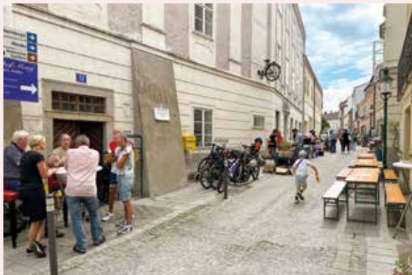
Der Altstadtfest-Flohmarkt zog zahlreiche Aussteller an.