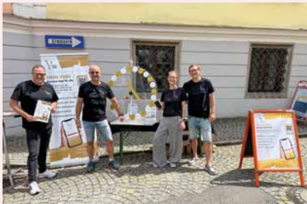
Die Ybbser Wirtschaft stellte die mein-ybbs-App vor.