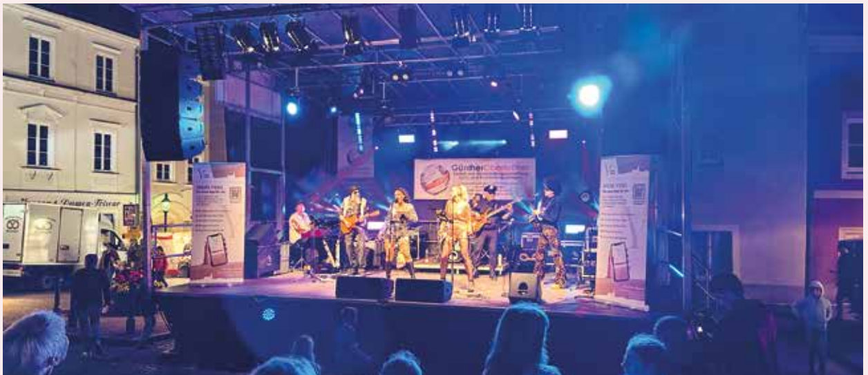
Crazy Heels sorgten beim Altstadtfest am Abend auf der Bühne am Hauptplatz für Unterhaltung mit Musik und Show.

Am 25. Mai 2024 ging in Ybbs das jährliche Altstadtfest über die Bühne. Vom Hauptplatz bis zum Schiffmeisterplatz, von der Herrengasse bis zum Kirchenplatz verwandelte sich die Ybbser Innenstadt in eine große Vergnügungsmeile, die für jeden und jede etwas zu bieten hatte.