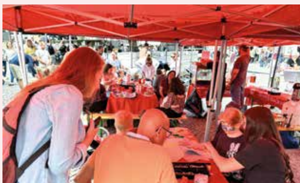
Kinderschminken und Basteln bei den Kinderfreunden.