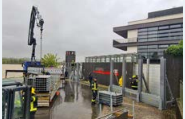
Lückenschluss und Aufbau HWS an der Donaulände Ybbs.