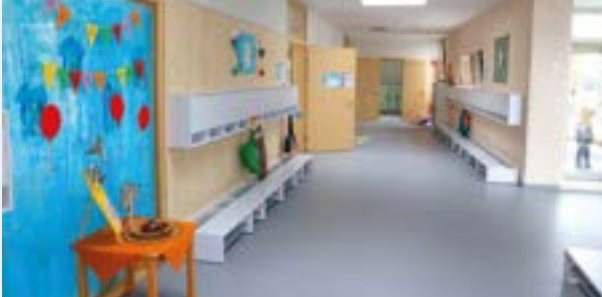
Offene, helle Räumlichkeiten prägen die Atmosphäre.