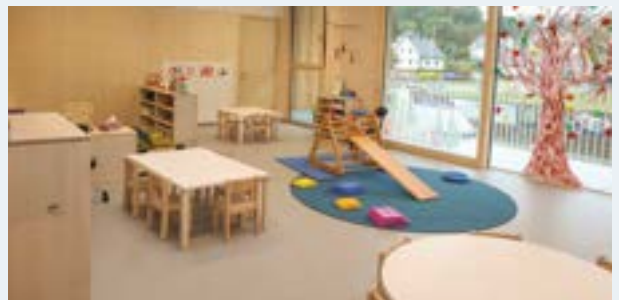
Spiel und Spaß werden im KIGA 2 groß geschrieben.

Die Erweiterung des KIGA 2 war aufgrund des steigenden Bedarfs an Betreuungsplätzen erforderlich. Zusätzlich wurde eine Tagesbetreuungseinrichtung für Kinder von ein bis zwei Jahren eingerichtet. Dieses Angebot wird im Auftrag der Stadtgemeinde von der Volkshilfe NÖ