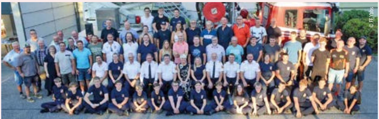
50 Jahre Spiel, Spaß, Spannung, Lernen, Erkunden, Ausflüge, Überraschungen, aber vor allem 50 Jahre sinnvolle Freizeitbeschäftigung und 50 Jahre glückliche, begeisterte und engagierte Kinder. 262 Jugendliche wurden bisher ausgebildet, 64 davon sind immer noch in der aktiven Mannschaft tätig. Die Stadtgemeinde gratuliert dem Team.