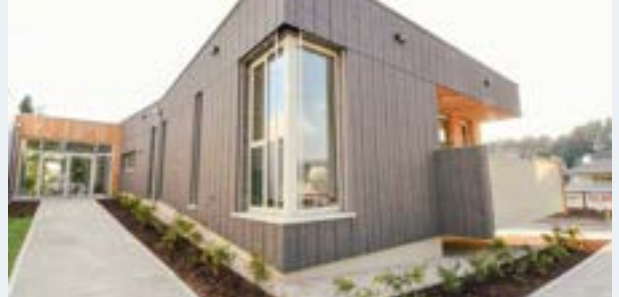
Der Kindergarten wurde in Holzbauweise errichtet.