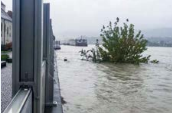
Die Donau erreichte in Ybbs ein Maximum von 7,18 Meter.