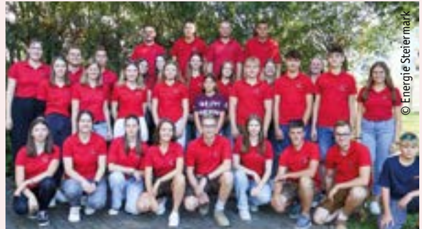
Das Team der Landjugend Ybbs-St. Martin übertraf sich wieder selbst: Die Marathon-Aufgabe erhielt man am Freitag um 15.00 Uhr, 42 Stunden später war man fertig.

Die Sandkiste, den Wasserlauf und den gesamten Gartenzaun zu erneuern, war die Aufgabe. Ebenso sollte eine Gatschküche geplant und errichtet werden. Die vielseitig aufgestellte Truppe der Landjugend im Alter von 14 bis 25 Jahren schaffte dies und noch mehr in 42,195 Stunden! ■