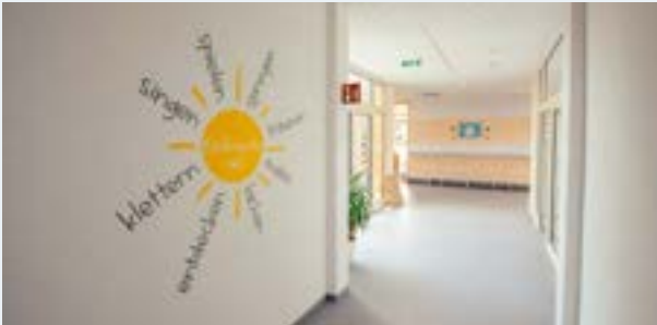
Ein Kindergarten für einen guten Start ins Leben.