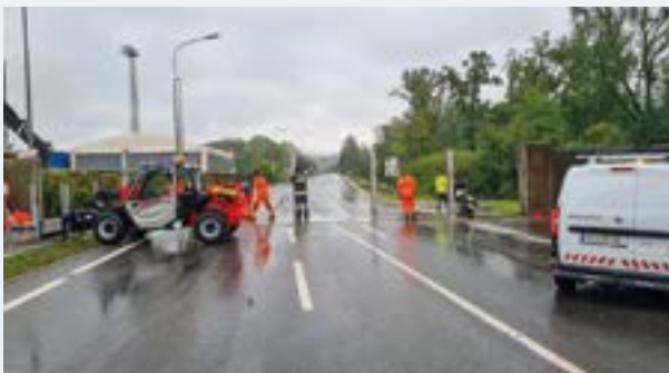
Sperre Ybbsbrücke wird von Bauhof & FF Ybbs vorbereitet.