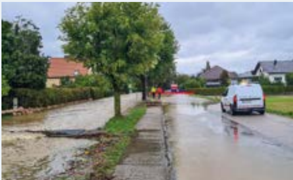
Mobiler Hochwasserschutz in der Feldmüllerstraße.