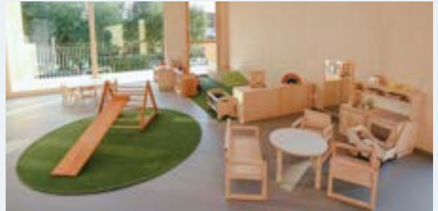
Alles ist für die hochwertige Tagesbetreuung vorbereitet.