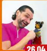
PEZI & DIE SCIENCE BUSTERS Ein Gipfeltreffen mitten in der Märchenstadt