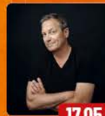
DIETER NUHR NUHR auf TOUR