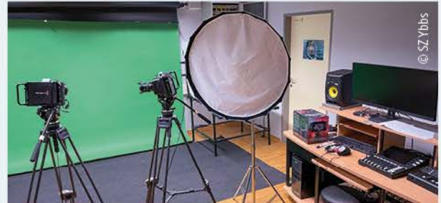
Das neu eingerichtete INNO-Lab für Schüler:innen der HAK/HAS und IT-HTL.

Um eine Ausbildung auf dem neuesten Stand zu gewährleisten, wurden in der HTL mit dem Siegergeld vom Wettbewerb proHTL zwei INNO-Labs eingerichtet, die den Schüler:innen auch außerhalb der Unterrichtszeit für Projekte und Diplomarbeiten zukünftig zur Verfügung stehen werden.