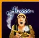
HORIZONT THEATER Aladdin Schulveranstaltung

03.04. & 04.04. DO & FR | Stadthalle Ybbs