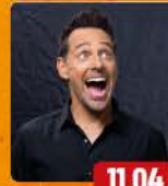
TRICKY NIKI GRÖSSENWAHN